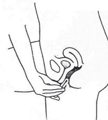
Sådan kan du selv indføre vaginalringen