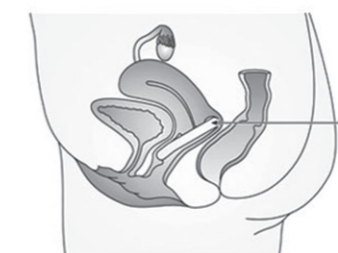
Sådan sidder vaginalringen i toppen af skeden omkring livmodermunden