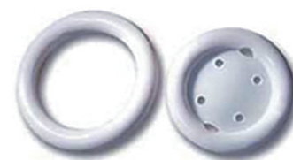
Eksempler på vaginalringe

En vaginalring er fremstillet af et vævsvenligt materiale. Der findes forskellige typer - alle har 2 bøjemærker, så ringen kan foldes sammen. Ringene findes i forskellige størrelser.